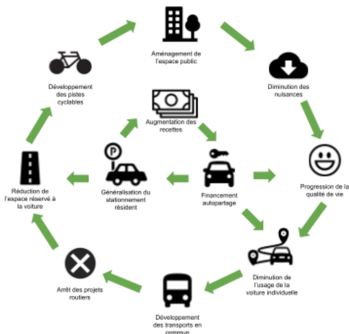
Le cercle vertueux des mobilités

Il est pourtant bien connu que dans le domaine de la mobilité, l'offre crée la demande . C'est un cercle vertueux qu'il faut enclencher de toute urgence pour répondre aux messages des scientifiques du climat et anticiper les risques géopolitiques : moins de voies routières, plus d'espace pour développer les modes alternatifs, moins de voitures, moins de bruit et de pollution en ville, davantage de confort de vie... Nos habitudes de déplacements doivent changer et nos élus et décideurs doivent avoir le courage politique de lancer le mouvement par des mesures fortes.